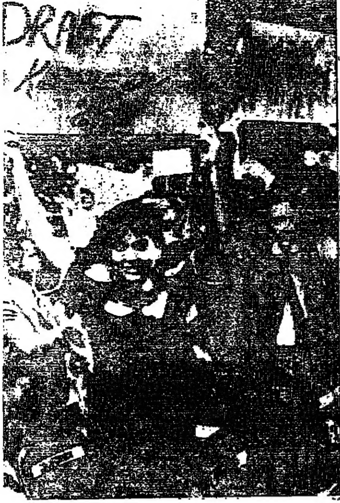
أقيم بعض أنصار السناتور أوداركيتي شقيق السناتور الراحل روبرت كينيدي الحزب الديمقراطي الذي يقعد الآن في شيكاغو مطالبين بترشيح الحزب له لرئاسة الجمهورية في الانتخابات الرئاسية في نوفمبر القادم.

وقال الماستر تشينيك في كلمة ألقاها في البرلمان ليلة أمس أن الحكومة تشكركم على جهودهم الرامية إلى العمل على استقرار الوضع في تشيكوسلوفاكيا من خلال وقف إطلاق النار.